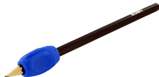
Visuel de référence: exemple d'utilisation