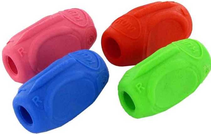
Schreibhilfe Sattler Grip