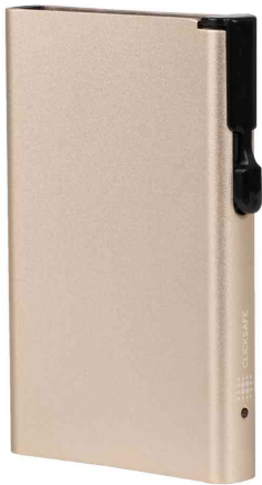
Kartenetui mit Clickbutton & RFID-Schutz, champagner