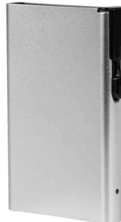
Kartenetui mit Clickbutton & RFID-Schutz, silber