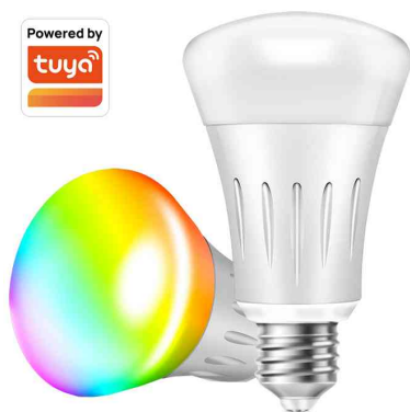
Ampoule LED WiFi Smart R63, culot : E27