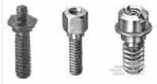
TE Teilnr.:750831-1 .050SR FEM SCRLCK KIT,SLIM LN