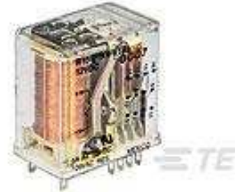
TE Teilnr.:8-1393766-1 R10-E1Z4-V700=R10