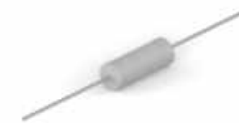
TE Teilnr.:1-2176412-2 5W XSM M/OX 5% 15R