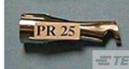
TE Teilnr.:991965-000 PR-25-REFLECTOR