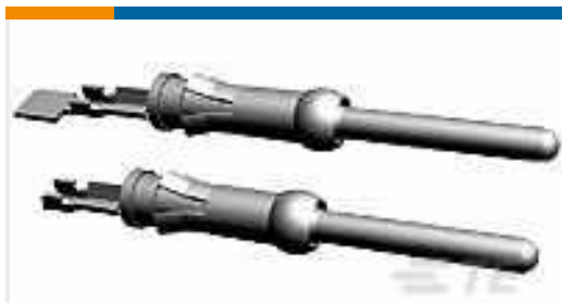
TE Teilnr.:1-66597-0 III+ PIN,18-14,30AU/FL,STRIP