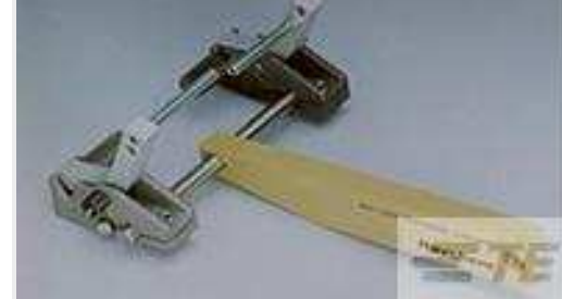
TE Teilnr.:993850-000 AD-1319-9