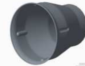
TE Teilnr.:EH0598-000 HL-ADPT-PR-REFLECTORS