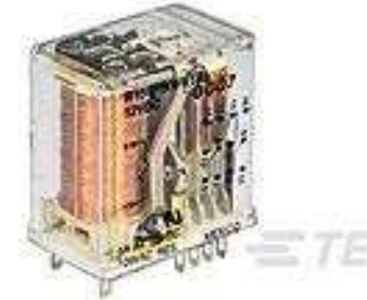
TE Teilnr.:8-1393766-6 R10-E1Z6-V430=R10