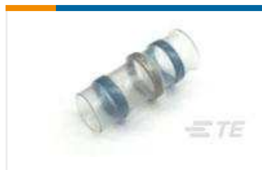
TE Teilenummer114163-000 CWT-9003