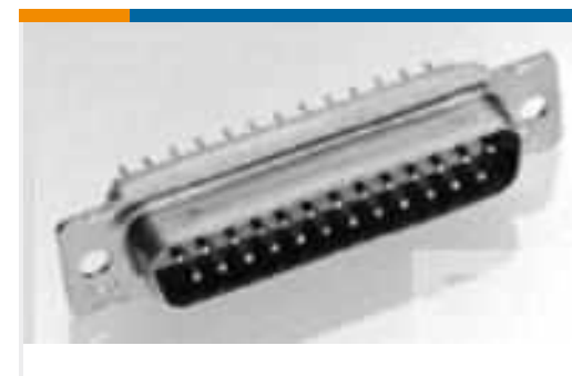
TE Teilenummer1757820-8 AMPLIMITE,ASY,RCPT,STD,109,ZN,3,CT