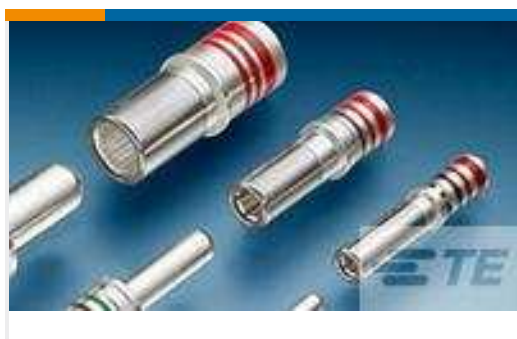
TE Teilenummer0662-207-0882 CONT SOC ASSY