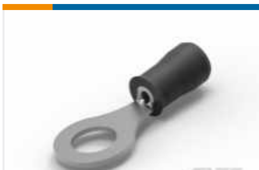
TE Teilenummer36149 PIDG RINGZUNGENKABELSCHUHE