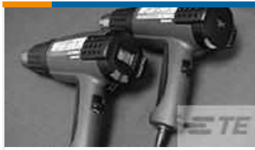
TE Teilenummer CJ2087-000 HL2010E-KIT-120V