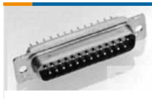
TE Teilenummer205560-2 AMPLIMITE,ASY,PLUG,STD,109,3