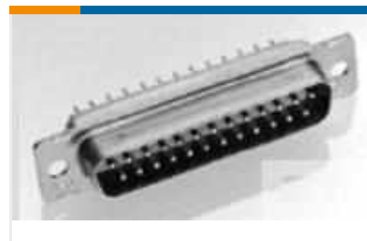
TE Teilenummer1757819-8 AMPLIMITE,ASY,PLUG,STD,109,ZN,3,CT