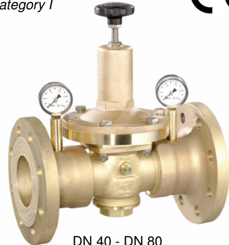
DN 40 - DN 80 (Ausführung / design DN 80)