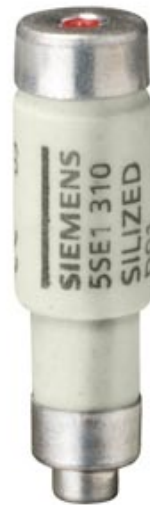
SILIZED-SICHERUNGSEINSATZ 400V GR, HALBLEITERSCHUTZ GR.D01 10A