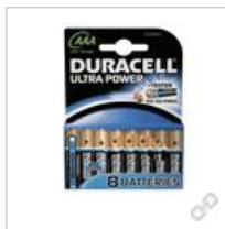
Duracell Ultra Power-AAA(MN2400/ LR03) BPH8 Dclick mit