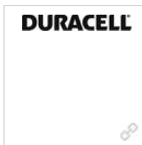
Logo DURACELL schwarz