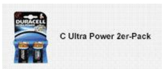
C Ultra Power 2er-Pack