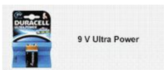
9 V Ultra Power