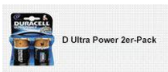
D Ultra Power 2er-Pack