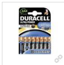
Duracell Ultra Power-AAA(MX2400/ LR03) BPH8 Dclick mit