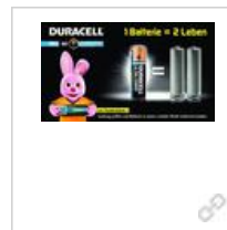
Anzeigenvorlage Duracell Ultra Power Powercheck DACH