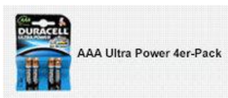
AAA Ultra Power 4er-Pack