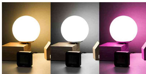
Visuel de référence: présente le produit en utilisation