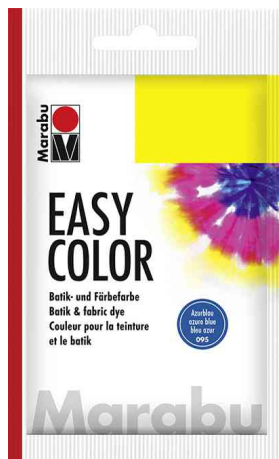
Visuel de référence : Couleur pour teinture et batik EASY COLOR