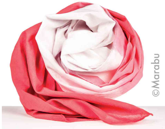
Visuel de référence : présente le produit en utilisation