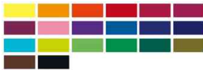
Aperçu des couleurs