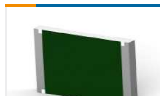
TE Teilnr.:8-2176407-8 3560 27R 5%