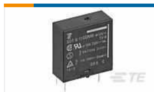
TE Teilnr.:8-1419125-5 SDT-S-106LMR,000