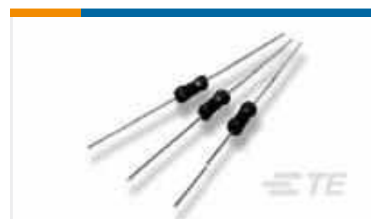
TE Teilnr.:4-1879350-2 RR01 5% 11R AMMO