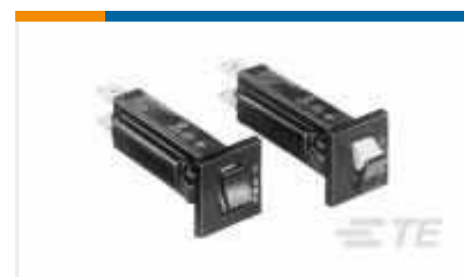
TE Teilnr.:1-1393250-7 W28-XQAT-15=W28