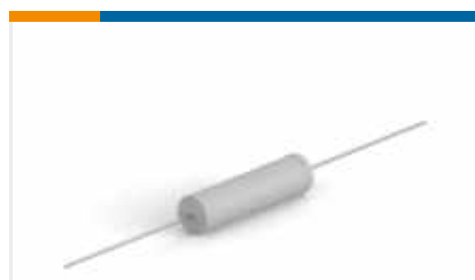
TE Teilnr.:4-2176414-8 7W STD M/OX 5% 1K8