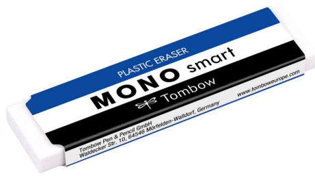
Kunststoff-Radierer "MONO smart", extra schmal