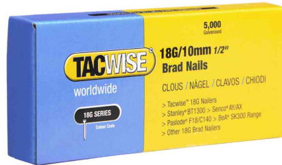
Nägel für Tacker 180/10 mm (18G/10)