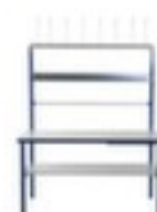
Table d'emballage complète