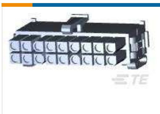
TE Teilnr.:794208-1 18P MINI UMNL2 PLUG HSG UL94V0