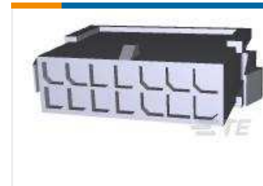
TE Teilnr.:1-794615-4 PANEL MT DBL ROW HSG 14 POS