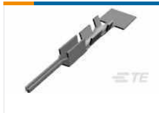
TE Teilnr.:1-794608-1 PIN CONT 20-24 15 GOLD STRIP