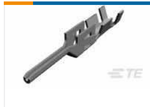
TE Teilnr.:1-794612-1 PIN CONT 20-24 15 GOLD L/P