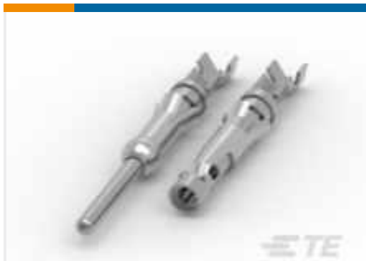
TE Teilnr.:1-66360-2 Stift-/Buchsenkontakte, Einzelausführung, Typ III