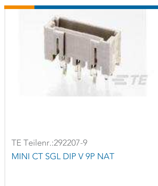
TE Teilnr.:292207-9 MINI CT SGL DIP V 9P NAT