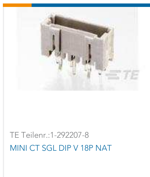
TE Teilnr.:1-292207-8 MINI CT SGL DIP V 18P NAT