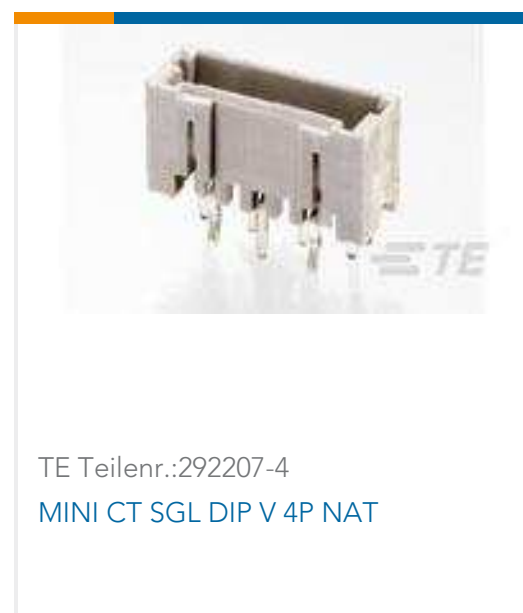
TE Teilnr.:292207-4 MINI CT SGL DIP V 4P NAT