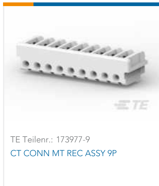
TE Teilnr.: 173977-9 CT CONN MT REC ASSY 9P