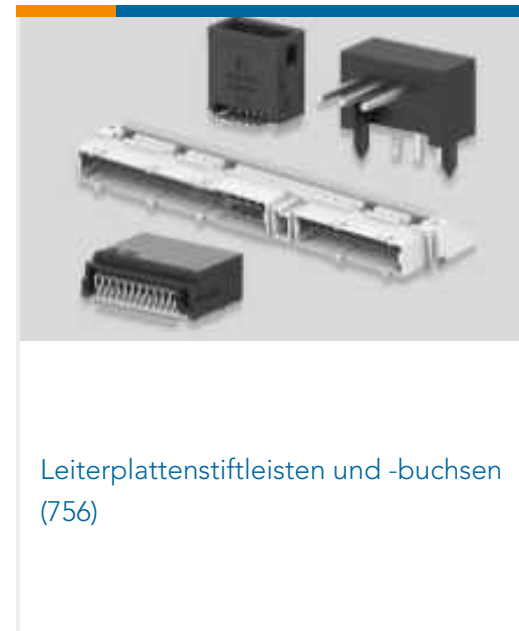
Leiterplattenstiftleisten und -buchsen (756)