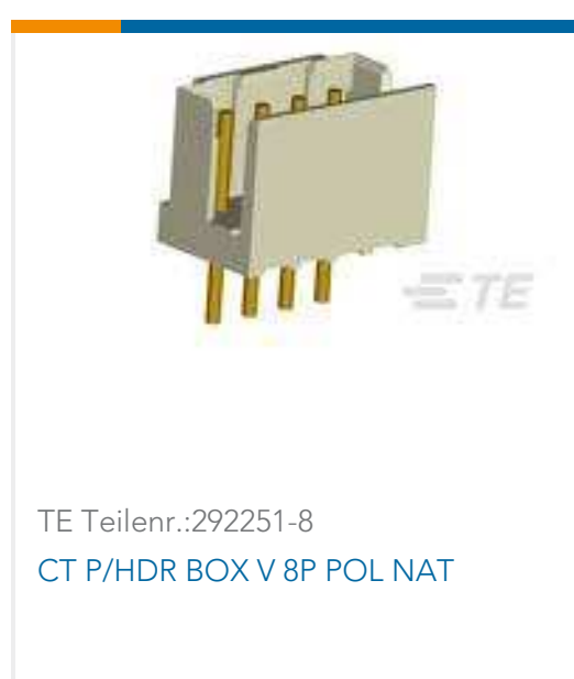
TE Teilnr.:292251-8 CT P/HDR BOX V 8P POL NAT