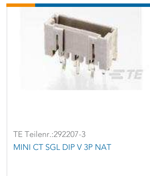
TE Teilnr.:292207-3 MINI CT SGL DIP V 3P NAT