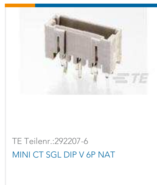
TE Teilnr.:292207-6 MINI CT SGL DIP V 6P NAT