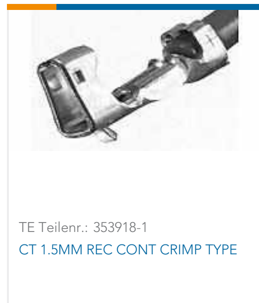
TE Teilnr.: 353918-1 CT 1.5MM REC CONT CRIMP TYPE