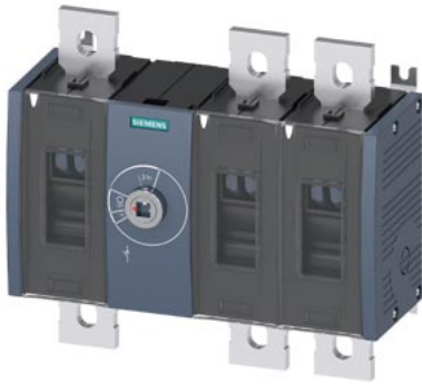
Lasttrennschalter 500A, Baugr. 4, 3-polig Frontantrieb mittig Grundgerät ohne Handgriff Flachanschluss