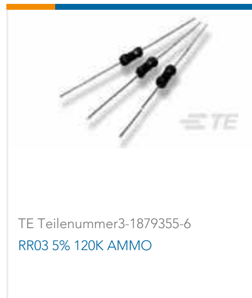
TE Teilenummer3-1879355-6 RR03 5% 120K AMMO