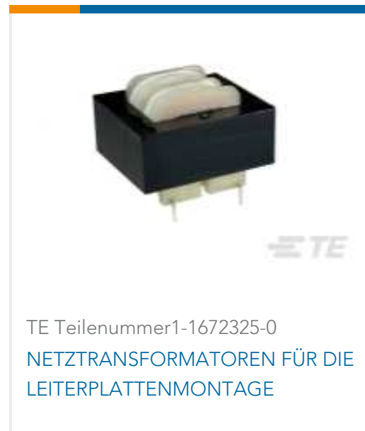
TE Teilenummer1-1672325-0 NETZTRANSFORMATOREN FÜR DIE LEITERPLATTENMONTAGE