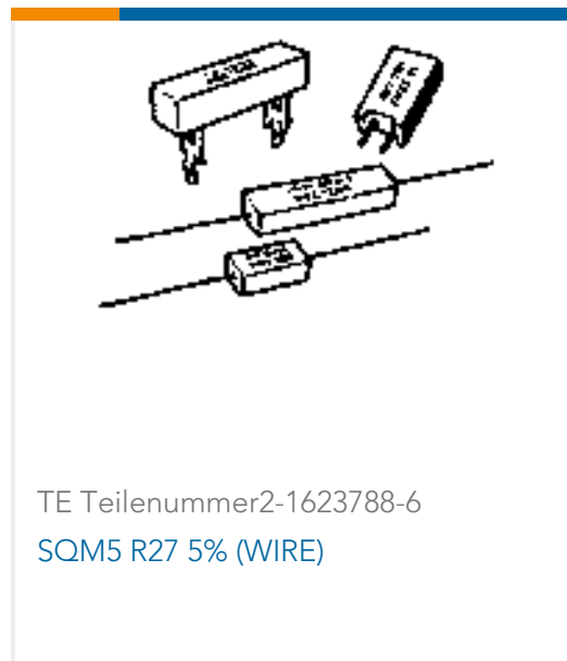
TE Teilenummer2-1623788-6 SQM5 R27 5% (WIRE)