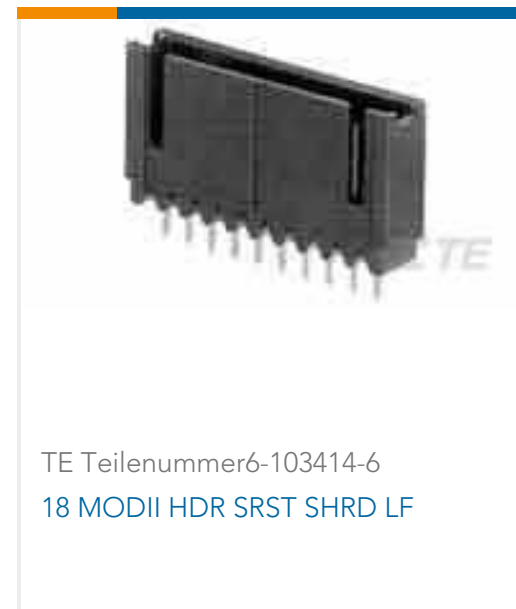
TE Teilenummer6-103414-6 18 MODII HDR SRST SHRD LF