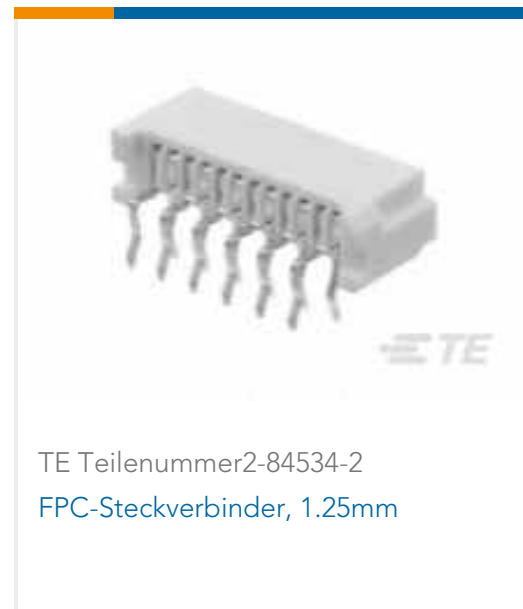
TE Teilenummer2-84534-2 FPC-Steckverbinder, 1.25mm