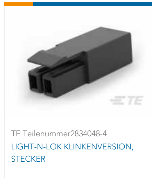
TE Teilenummer2834048-4 LIGHT-N-LOK KLINKENVERSION, STECKER