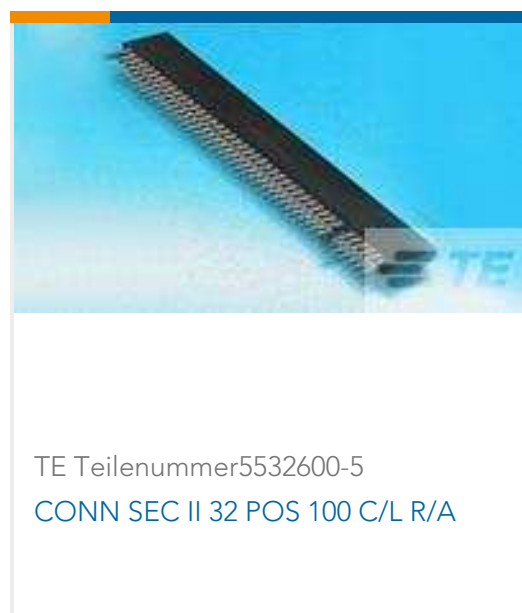
TE Teilenummer5532600-5 CONN SEC II 32 POS 100 C/L R/A