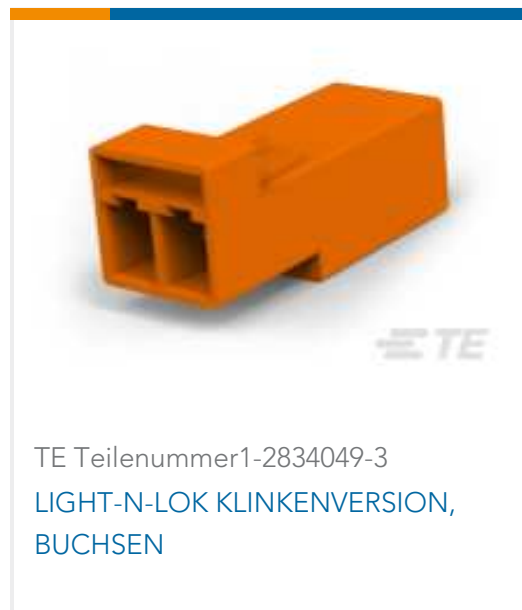
TE Teilenummer1-2834049-3 LIGHT-N-LOK KLINKENVERSION, BUCHSEN