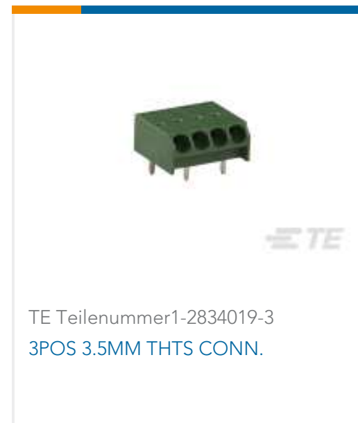
TE Teilenummer1-2834019-3 3POS 3.5MM THTS CONN.