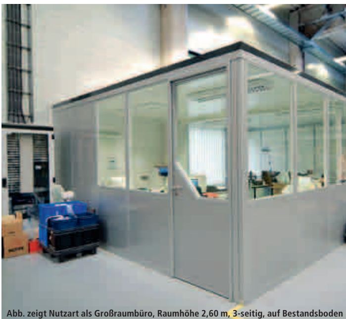
Abb. zeigt Nutzart als Großraumbüro, Raumhöhe 2,60 m, 3-seitig, auf Bestandsboden