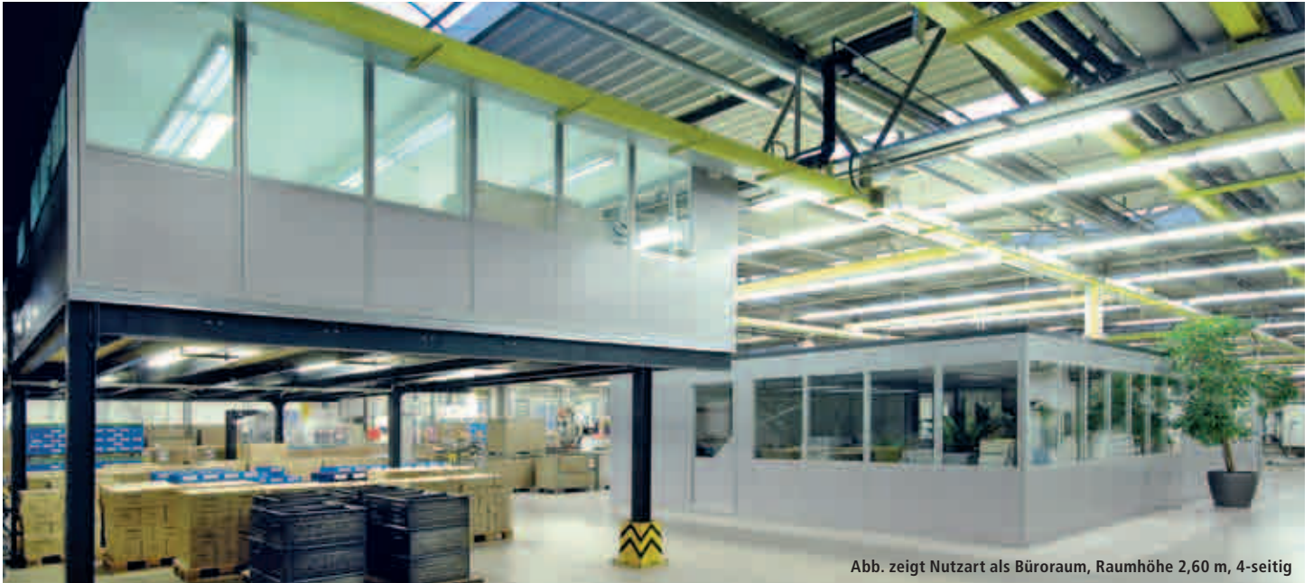
Abb. zeigt Nutzart als Büroraum, Raumhöhe 2,60 m, 4-seitig