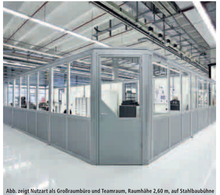
Abb. zeigt Nutzart als Großraumbüro und Teamraum, Raumhöhe 2,60 m, auf Stahlbaubühne