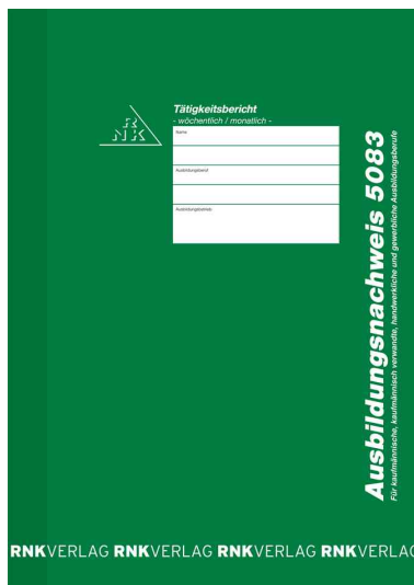
Ausbildungsnachweis-Heft 5083, wöchentlich / monatlich