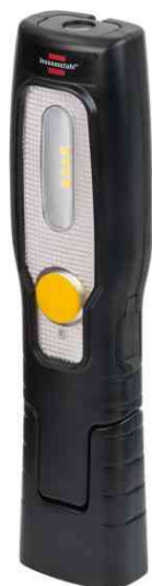
LED Akku-Handleuchte HL 200 A