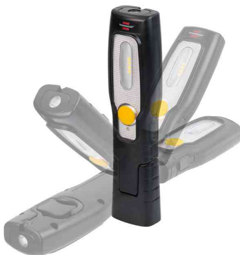
LED Akku-Handleuchte HL 200 A , knickbarer Fuß