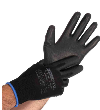
Visuel de référence : gant de travail "Black ACE TOUCH"