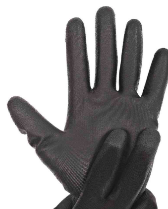
Vue détaillée du gant de travail pour écran tactile "Black ACE TOUCH"