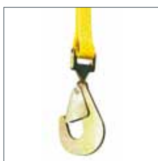
GKH - mit gedrehten Karabinerhaken