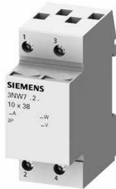
SETRON, Zylindersicherungshalter, 10x38 mm, 2-polig, In: 32 A, Un AC: 690 V, LED Signalmelder