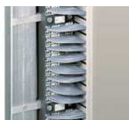
Montagebeispiel Rangierwaben im Gestellrahmen