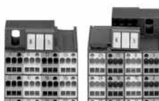
Individuelle Gruppenbeschriftung mit WMB-Beschriftungssystem