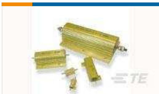
TE Teilnr.:1-1630027-9 HSC300 6R0 5%