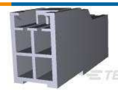
TE Teilnr.:176284-9 AMP UNIVERSAL POWER CAP 4P