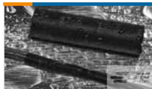
TE Teilnr.:121397P024 ES2000-NO.3-B8-0-STK