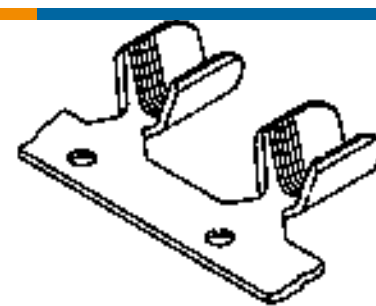
TE Teilnr.:62194-2 MIN AMVAR SPLC 016TPBR