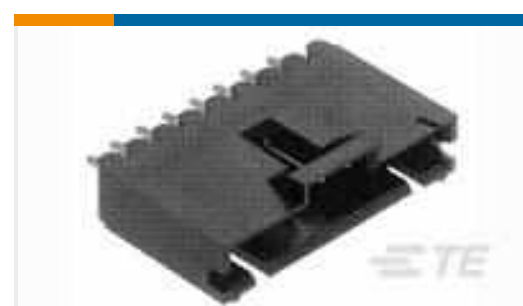
TE Teilenummer5-103908-2 03 MTE HDR SRST LATCH W/HLDWN