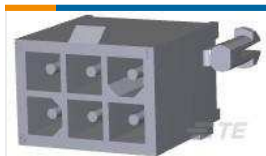
TE Teilenummer1-770875-0 06P MINI UMNL HDR ASSY SN