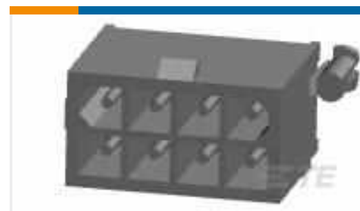
TE Teilenummer1-794073-0 08P MINI UMNL HDR W/O DH SN LF