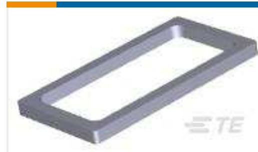
TE Teilenummer794772-6 06P MINI UMNL SEAL,DIE CUT