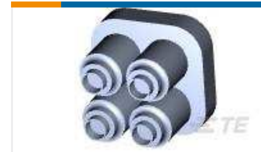
TE Teilenummer1586359-4 04P MINIMUMNL GANG WIRE SEAL DR