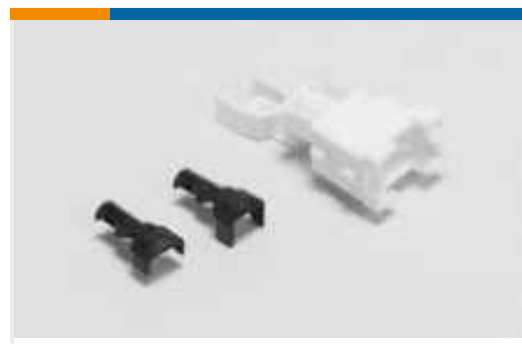
Rechteckige Abdeckkappen und Kabelklemmen(2)