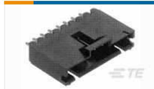
TE Teilenummer5-103908-3 04 MTE HDR SRST LATCH W/HLDWN