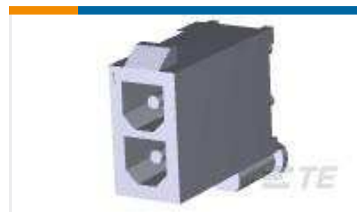
TE Teilenummer1-770872-0 02P MINI UMNL HDR ASSY SN