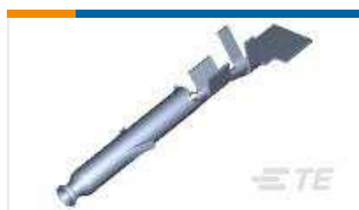
TE Teilenummer770902-1 MINI UMNL SOCK 26-22 AWG SN