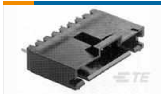
TE Teilenummer5-104362-2 03 MTE HDR SRST LATCH W/HLDWN