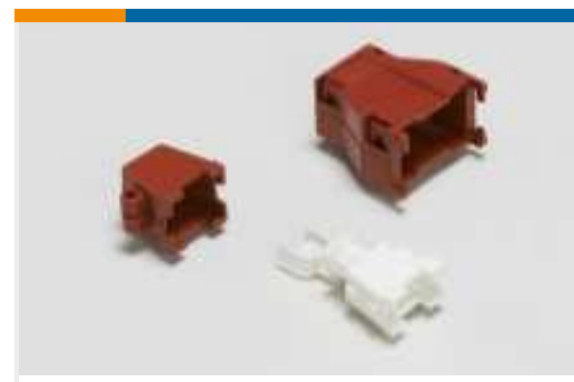
Rechteckige Muffen und Zugentlastung(2)