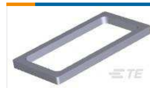
TE Teilenummer794772-4 04P MINI UMNL SEAL,DIE CUT