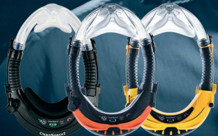
CLEANSACE2™ CLEANSACE ULTRA CLEANSACE EX