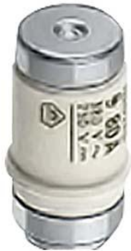
NEOZED-SICHERUNGSEINSATZ 400V GL/GG,GR.D02, 63A,FALTSCHACHTEL