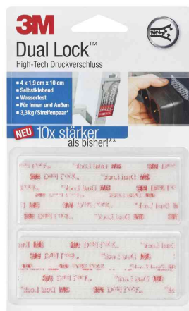
Dual Lock Klett-Power SJ3560