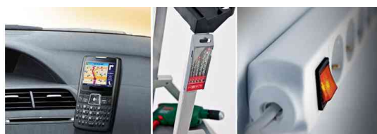
Visuel de référence: exemples d'utilisation - sans accessoires