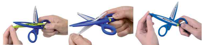
Konturenschere - einfaches Tauschen der Klinge