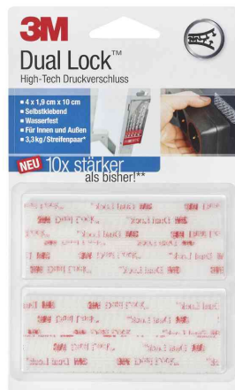
Dual Lock Klett-Power SJ3560