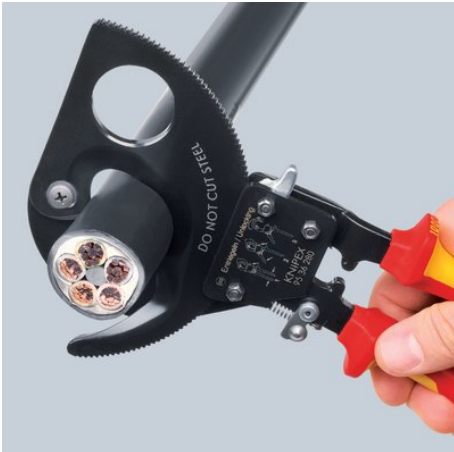
racsnis működési elv és kétfokozatú fogaskoszorú hajtás az erőkimélő vágáshoz