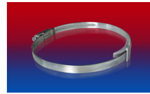
CLAMP 210 BRIDGE CLAMP