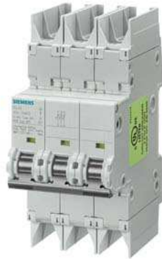
Leitungsschutzschalter 10kA, 3-polig, D, 16A nach UL 489-480Y/277V