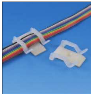
Befestigungssockel TY8H1(S) - je nach Anforderung schraubbar oder selbstklebend.