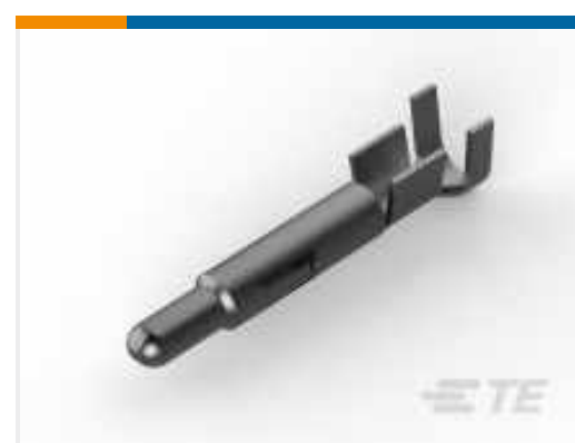
TE Teilenummer 926898-3 UNIV.M-N-L.PIN