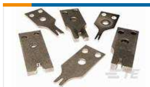
TE Teilenummer3-1633961-4 CRIMPER, INSULATION F PREMIUM