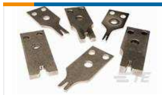
TE Teilenummer1-2119784-1 CRIMPER, INSUL O PREMIUM