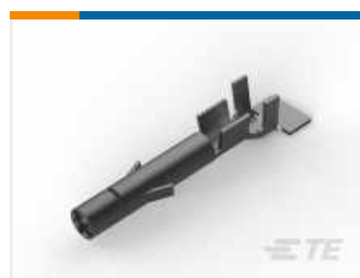
TE Teilenummer 926893-3 UNIV.M-N-L.SOCKET