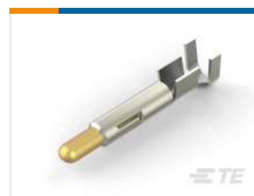
TE Teilenummer 926898-7 UNIV MNL SPLIT PIN LP