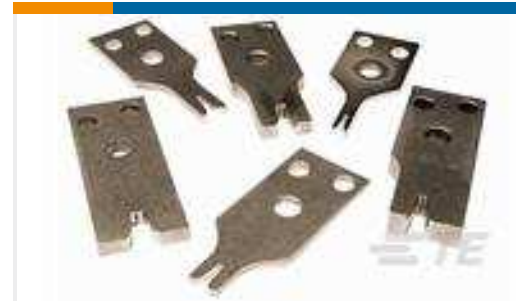
TE Teilenummer1633996-8 CRIMPER, INSULATION SPECIAL