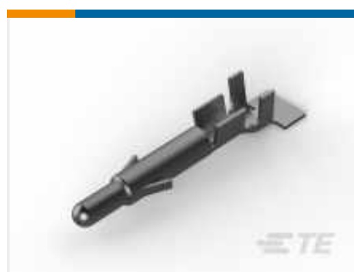
TE Teilenummer 926894-3 UNIV.M-N-L.PIN