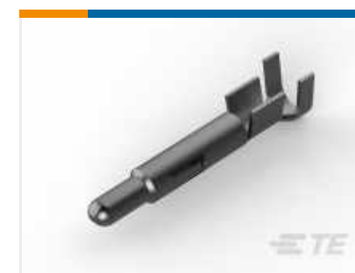
TE Teilenummer 926898-1 UNIV.M-N-L.PIN