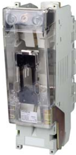
NH-SICHERUNGSUNTERTEIL GR.4A, 1-POLIG 1250A, 690V MIT FLACHANSCHLUSS