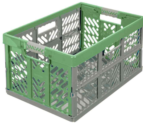
Profi-Klappbox "eco ben", grass green / grau