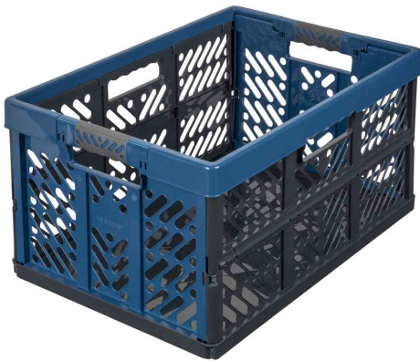
Profi-Klappbox "eco ben", blau / anthrazit

- ideal zum sicheren Verstauen und Transportieren von Lebensmitteln und schweren Gegenständen im Auto