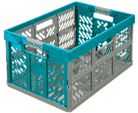
Profi-Klappbox "eco ben", sky blue / grau