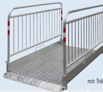
mit Tränenblech und Sicherheitsgeländer