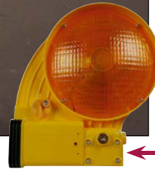
Bakenleuchte für Schrankenbäume mit Adapter, Bestell-Nr. 257-719-J0

Der Euro-1 Schrankenzaun ist nach den Anforderungen der TL Absperrschranken inkl. Absturzicherung geprüft.