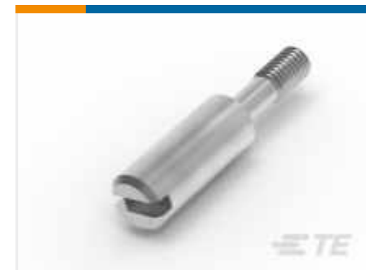
TE Teilnr.:T0931003003-000 CODING-PIN-M3