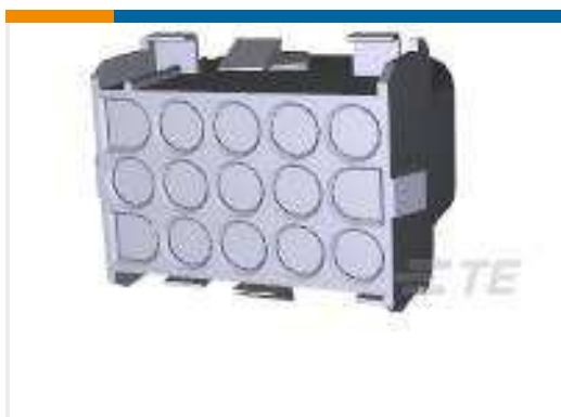
TE Teilnr.:1-480711-9 15P UMNL CAP HSG BLK