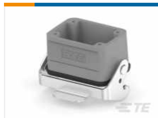
TE Teilnr.:T1730060000-000 H6B-TBF-T