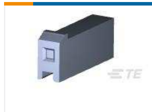
TE Teilnr.:640250-1 01P SL156 HSG W/LCK RAMP NATL