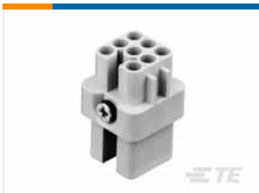
TE Teilnr.:T2020082201-000 HD-008-F