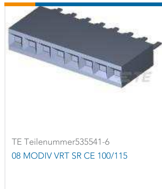
TE Teilenummer535541-6 08 MODIV VRT SR CE 100/115