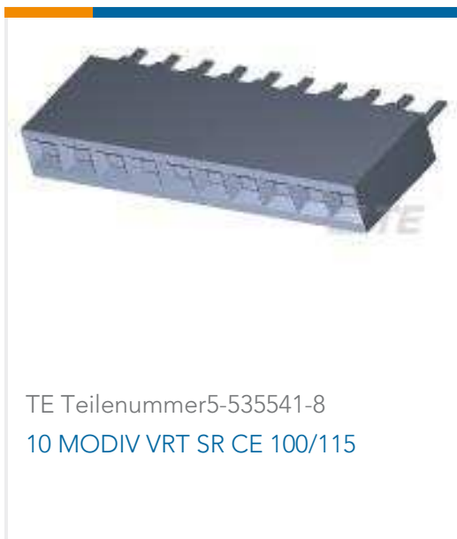
TE Teilenummer5-535541-8 10 MODIV VRT SR CE 100/115