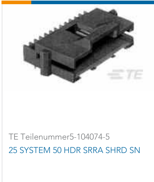
TE Teilenummer5-104074-5 25 SYSTEM 50 HDR SRRA SHRD SN