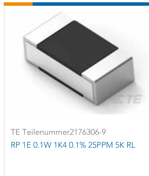
TE Teilenummer2176306-9 RP 1E 0.1W 1K4 0.1% 25PPM 5K RL