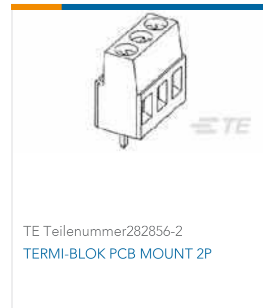
TE Teilenummer282856-2 TERMI-BLOK PCB MOUNT 2P