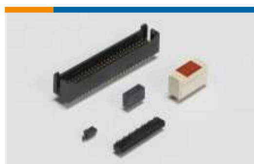
Leiterplatte-an-Leiterplatte-Steckkontakte und -sockel(1136)