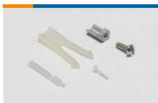
Kodierungen für Leiterplatten-Steckverbinder(4)