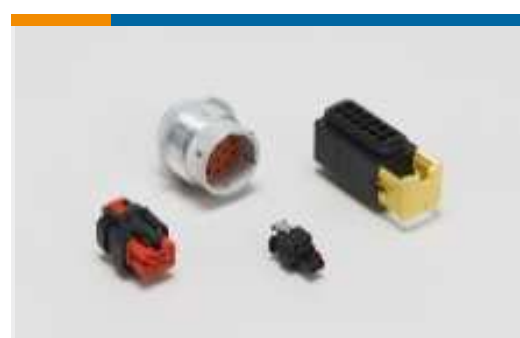
Gehäuse für Pkw, Lkw, Busse und Off-Road-Fahrzeuge(3)