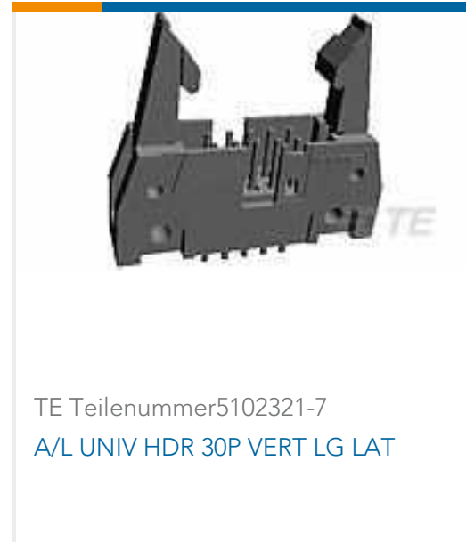
TE Teilenummer5102321-7 A/L UNIV HDR 30P VERT LG LAT