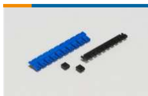
Leiterplatte-an-Leiterplatte-Jumper und -Brückenstecker(5)