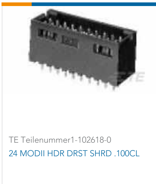
TE Teilenummer1-102618-0 24 MODII HDR DRST SHRD .100CL