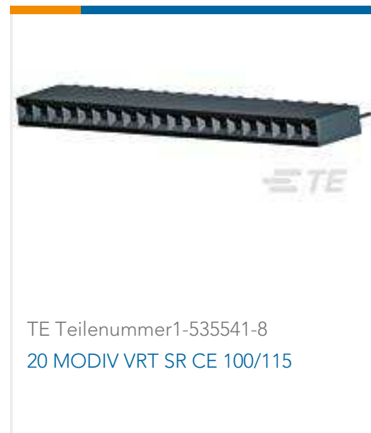
TE Teilenummer1-535541-8 20 MODIV VRT SR CE 100/115