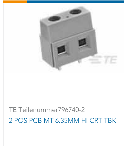
TE Teilenummer796740-2 2 POS PCB MT 6.35MM HI CRT TBK