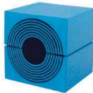
RM 60 24-54