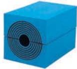
RM 40 10-32