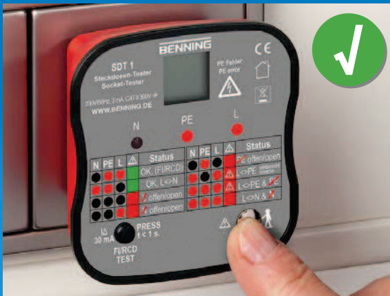
Steckdose korrekt installiert, Fingerkontakt prüft PE-Kontakt auf gefährliche Berührungsspannung.