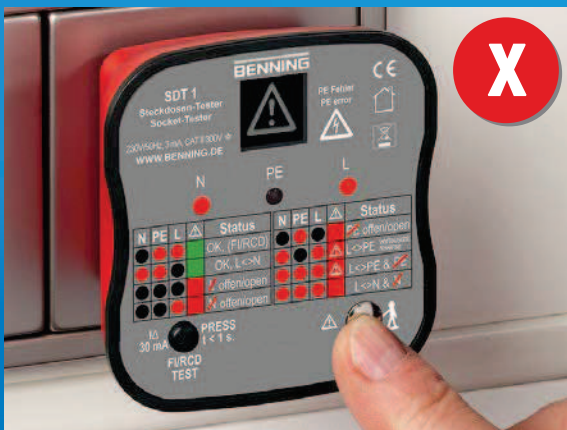
Steckdose mit Verdrahtungsfehler, Lebensgefahr! Außenleiter (L) und Schutzleiter (PE) wurden vertauscht!