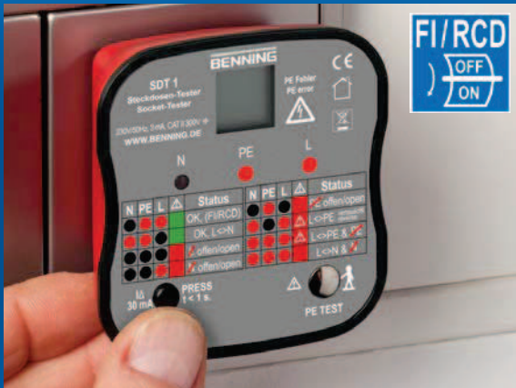
Prüfung der Auslösefunktion eines 30 mA FI/RCD-Schutzschalters durch Betätigung der Prüftaste.