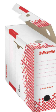
Visuel de référence: Boîtes d'archives Speedbox