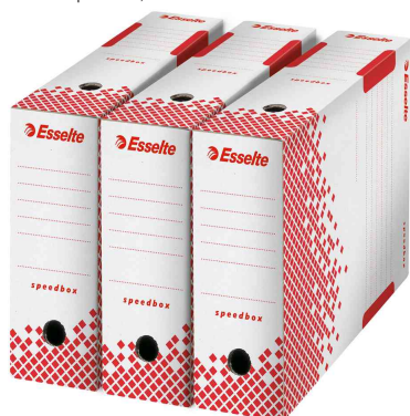
Visuel de référence: Boîtes d'archives Speedbox