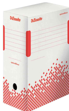
Boîtes d'archives Speedbox, 150 mm