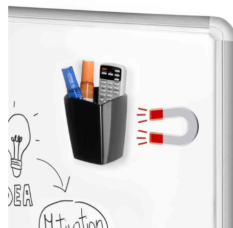
Pot à crayon magnétique, noir, exemple d'utilisation