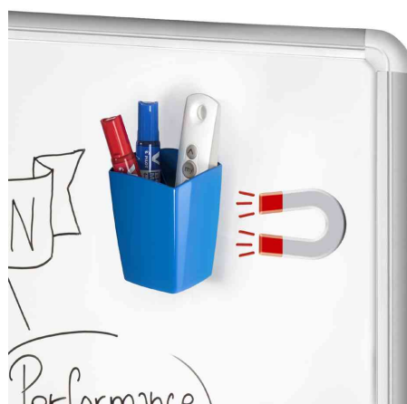
Pot à crayon magnétique, bleu océan, exemple d'utilisation