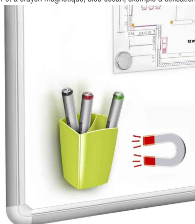
Pot à crayon magnétique, vert anis, exemple d'utilisation