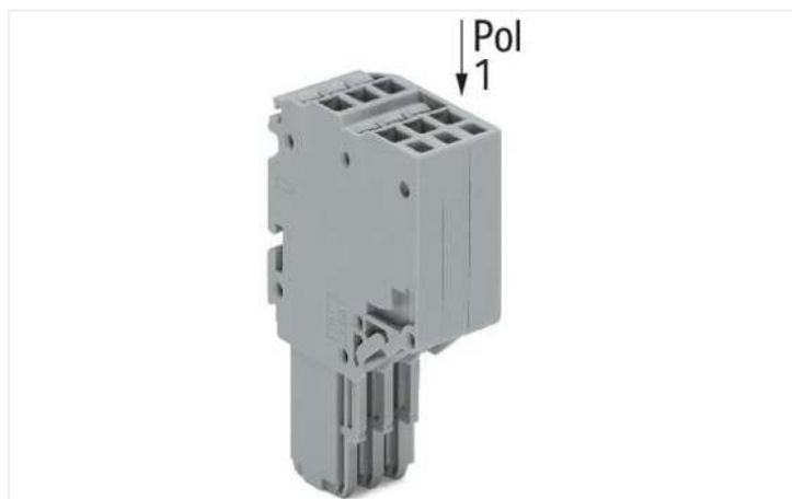
Farbe: ■ grau