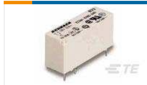
TE Teilnr.:2-1393222-7 V23061A1005A502=MINISTARKSTROM