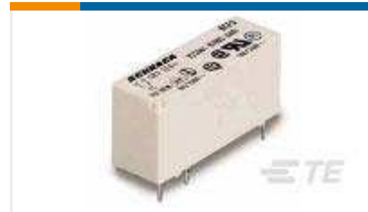
TE Teilnr.:9-1393222-7 V23061B1005A501=MINISTARKSTROM