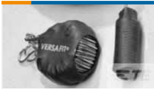
TE Teilnr.:F27135-000 VERSAFIT-MINI-SPL-3/16-BK