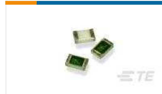
TE Teilnr.:9-1879221-7 CPF 0603 16R9 0.1% 25PPM 1K RL