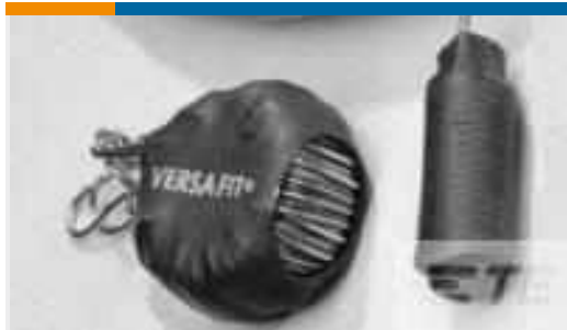
TE Teilnr.:D57591-000 VERSAFIT-MINI-SPL-3/8-BK