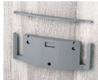
B7120048 Wandhalter-Set L PA 6 vulkan