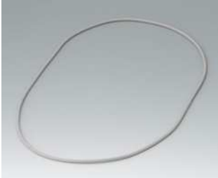
B7120005 Dichtung L